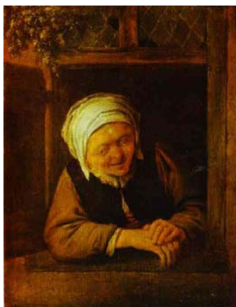
Adrian Van Ostade

Rosetta dalla finestra aspetta il nuovo welfare