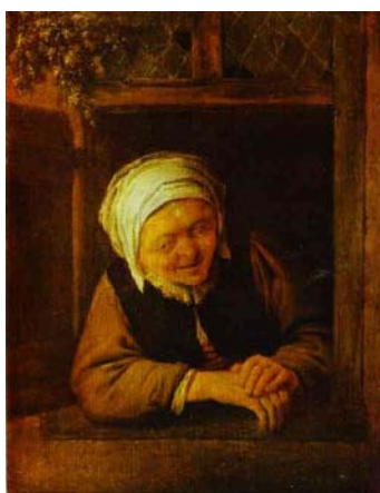
Adrian Van Ostade

Rosetta dalla finestra aspetta il nuovo welfare